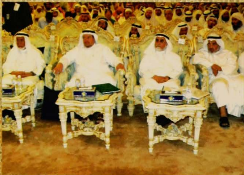
من اليسار معالي الوزير وسعادة الوكيل ورئيس الخبرة ومدير إدارة المسجد الكبير يشاركون في مجلس السماع