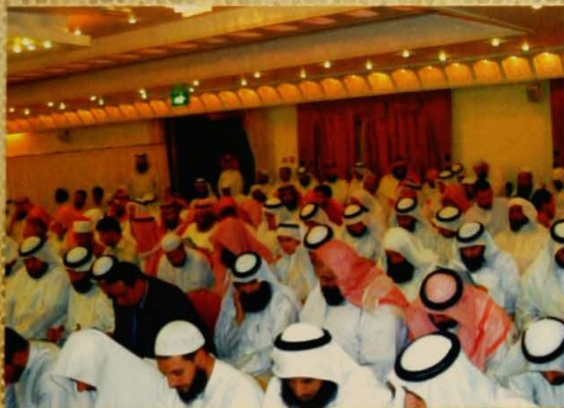
الإنصات والمقابلة من جمهور السماع