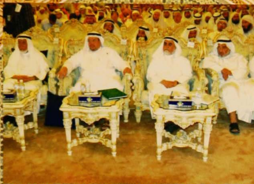
من اليسار معالي الوزير ورئيس المبرة ومدير إدارة المسجد الكبير ومدير مكتب الوزير في إصغاء لمجلس السماع