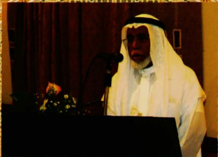
كلمة معالي الوزير بعد مجلس المشايخ