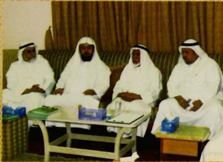
حفل العشاء في المنبرة بعد جلسة السماع مباشرة على شرف معالي الوزير والضيف والوكيل