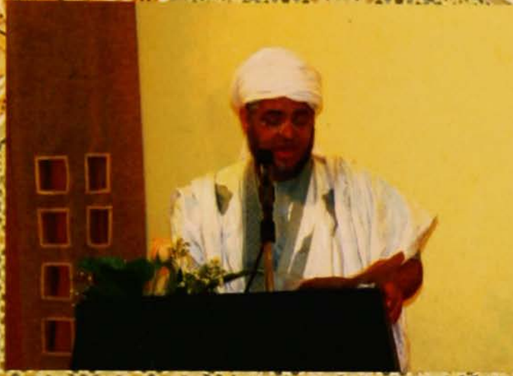
الشاعر الموريتاني محمد خال أبو الشنقيطي يشارك بقصيدة شكر للمهجرة والوزارة