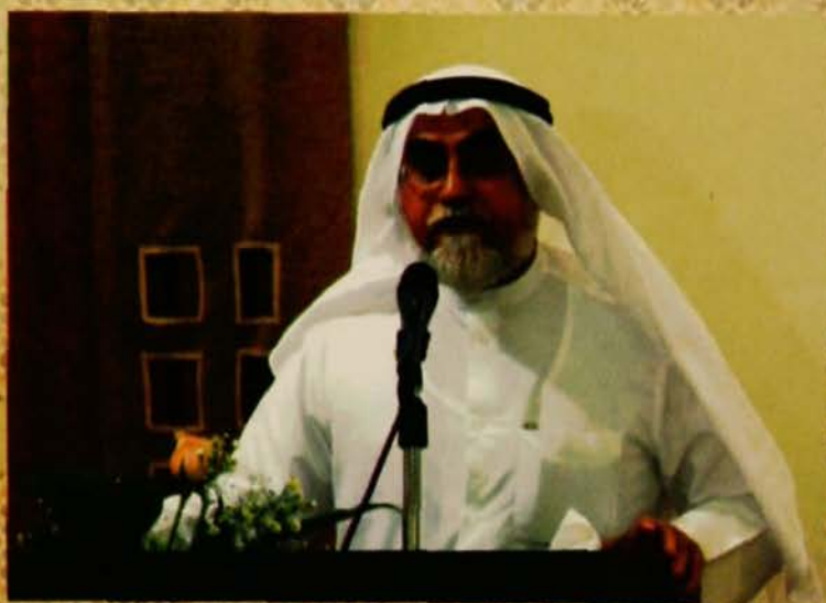
كلمة رئيس المبرة بعد مجلس السيفاع