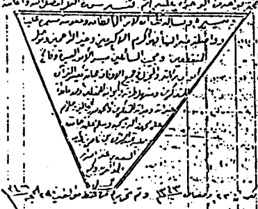
صورة الورقة الأخيرة من الجزء الثامن المخطوطة «أ»