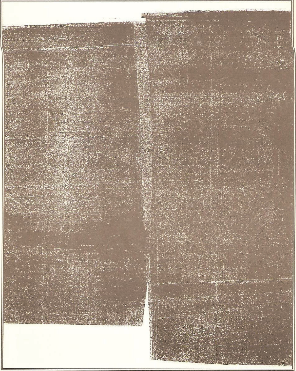
صورة للورقة الأخيرة مما تحصلنا عليه من المخطوط